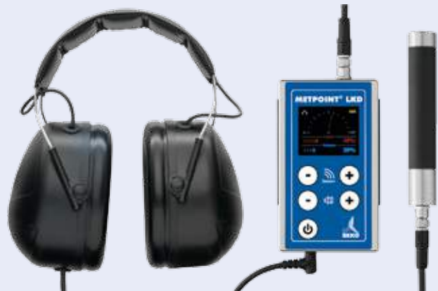
Ejemplos del producto extraídos de la gama. Los modelos no son vinculantes.

El METPOINT® LKD registra este ultrasonido, lo hace audible y lo visualiza. El METPOINT® LKD funciona con un altísimo grado de fiabilidad. Como sólo se registran las frecuencias que puedan corresponder a una fuga, su localización no supone ningún problema, independientemente del ruido generado por trabajos cercanos.